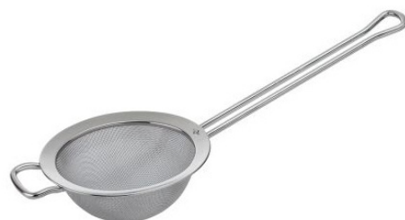
11 0990 28 12 Coladera acero inoxidable 12 cm $ 715.00