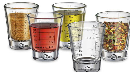
Muestra alimentos a medir