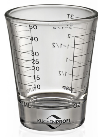
09 1250 35 50 Mini vaso medidor, 50 ml. $ 179.00