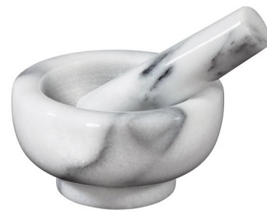
10 0243 08 11 Mortero con pistilo $ 789.00