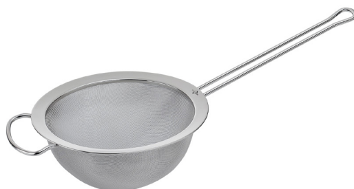
11 0990 28 20 Coladera acero inoxidable 20 cm $ 1,669.00