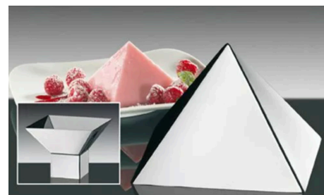
Decora tus platillos

09 0540 28 00 Molde para postres en forma de pirámide $ 275.00