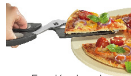
Función de pala