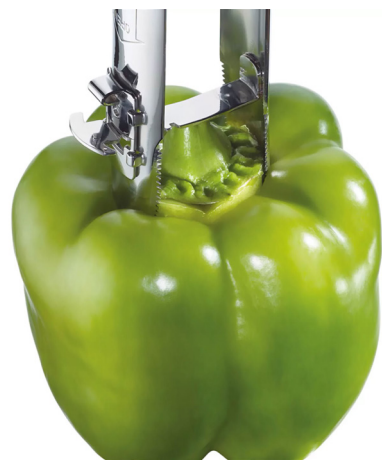
Sugerencia de uso

13 1088 28 00 Descorazonador de pimientos $ 339.00