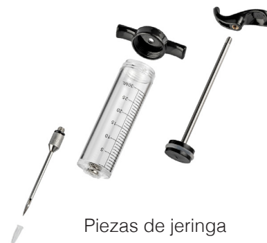
Piezas de jeringa