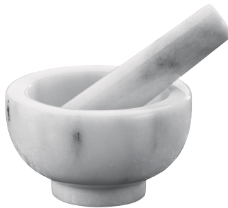
10 0243 08 08 Mortero con pistilo. $ 619.00