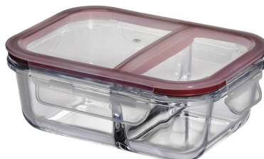
10 0160 35 00 Contenedor de vidrio con división 18.5 cm $ 639.00