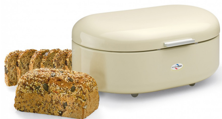
09 0317 22 00 Panera metal/ Beige $ 1,789.00