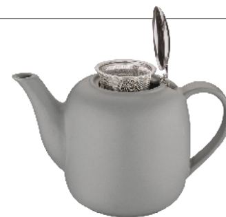
10 4600 19 00 Tetera "Londres" gris, 1.5 L. $ 1,239.00