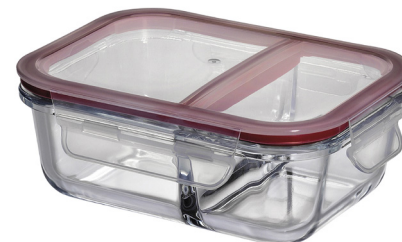
10 0161 35 00 Contenedor de vidrio con división 20 cm $ 829.00