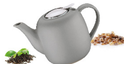
Ideal para tés o infusiones