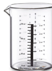
09 1195 35 50 Vaso medidor de vidrio 50 ml $ 209.00