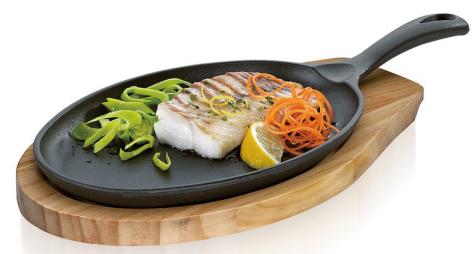
Sugerencia de uso

03 0515 10 24 Mini sartén ovalado con tabla de madera. $1,519.00