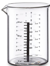
09 1195 35 15 Vaso medidor de vidrio 150 ml $ 249.00