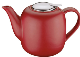
10 4600 14 00 Tetera "London", roja 1.5 L. $ 1,189.00