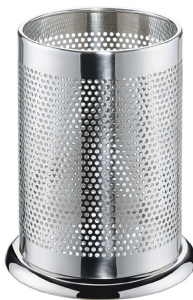
10 0242 28 00 Soporte para utensilios $ 619.00