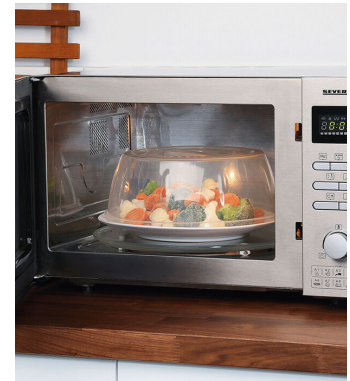
Sugerencia de uso