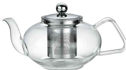
10 4572 35 00 Tetera "Tibet", 1.2 L. $ 2,059.00