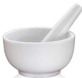
10 0673 82 07 Mortero con pistilo, 7 cm $ 319.00