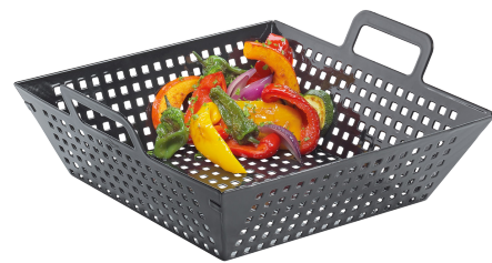
Cocción ideal, porciones grandes