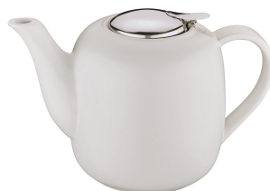
10 4600 22 00 Tetera "Londres" blanco, 1.5 L. $ 1,239.00