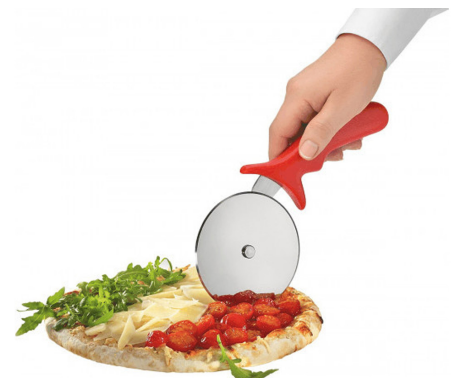
Corta con precisión

Cortador de pizza acero, 1 pieza $ 409.00