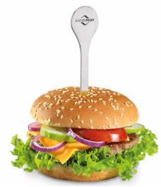
Sugerencia de uso

10 6647 28 02 Set 2 pinchos acero inoxidable $ 325.00