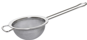
11 0990 28 09 Coladera acero inoxidable 9 cm $ 709.00