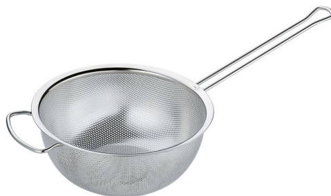
25 0610 28 22 Coladera de Cocina Deluxe 22 Cm Malla Fina $ 1,199.00