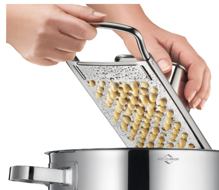
Sugerencia de uso