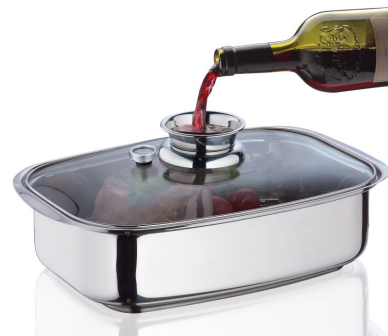
Sugerencia de uso