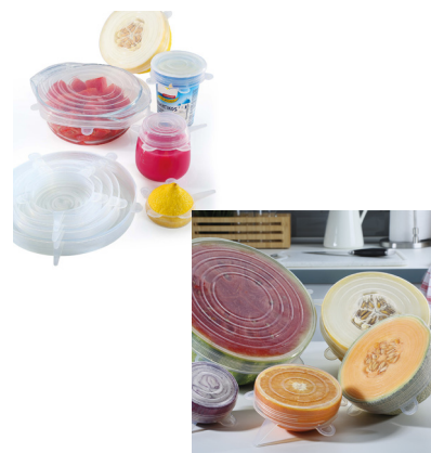
Sugerencia de uso