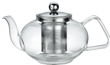
10 4571 35 00 Tetera "Tibet", 800 ml. $ 1,609.00