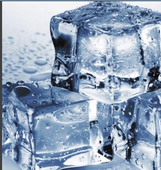
Fabrica de Hielo