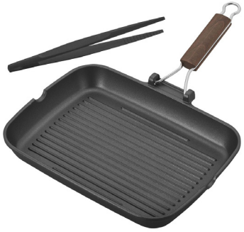
75001-839 COOKIN'ITALY | Set de Sartén Grill y Pinzas $2,169.00

Cada práctico juego proporciona a los chefs caseros las herramientas que necesitan para cocinar sin esfuerzo. El revestimiento antiadherente CORTAN de capas duraderas y multicapa de las sartenes es de liberación rápida para alimentos impecables que no se pegan. Tan fáciles de limpiar como de usar, garantizan una calefacción uniforme y sin puntos calientes para platos perfectamente dorados. Los sets de Cookin'Italy son perfectos para regalar