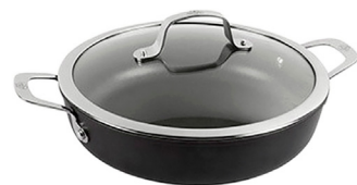
ALBG3ED-24D ALBA | Sartén Dos Asas de Aluminio con Titanio 24 cm $3,819.00