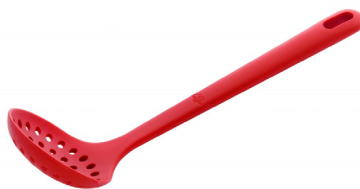
28000-002 ROSSO | Espumadera de Silicón Rojo 31 cm $589.00