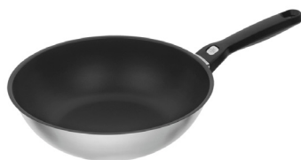
75002-881 PESARO | Wok de Acero Inoxidable 28 cm $2,579.00