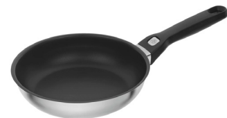
75002-877 PESARO | Sartén de Acero Inoxidable 20 cm $1,589.00