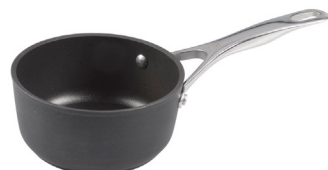
ALBG1L0-20U ALBA | Cazo de Aluminio Con Titanio 20 cm $3,009.00