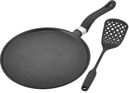
75000-666 COOKIN'ITALY | Set de Sartén y Espátula $2,169.00