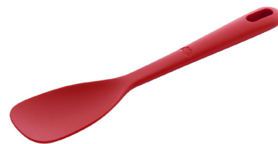
28000-004 ROSSO | Cuchara para Servir de Silicón Rojo 28 cm $589.00