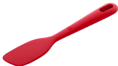
28000-006 ROSSO | Espátula de Silicón Rojo 23 cm $359.00