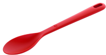
28000-009 ROSSO | Cuchara para Cocinar de Silicón Rojo 31 cm. $459.00