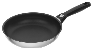
75002-878 PESARO | Sartén de Acero Inoxidable 24 cm $ 1,789.00