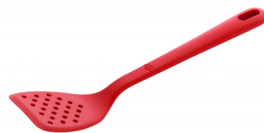
28000-003 ROSSO | Pala para Freír de Silicón Rojo 31 cm $659.00