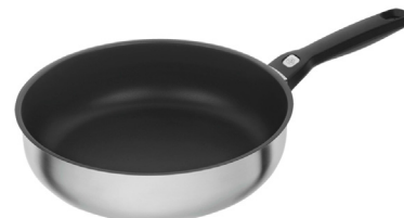
75002-880 PESARO | Sartén de Acero Inoxidable Alto 28 cm $2,389.00