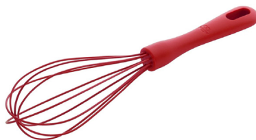
28000-007 ROSSO | Batidor de Globo de Silicón 29 cm $499.00